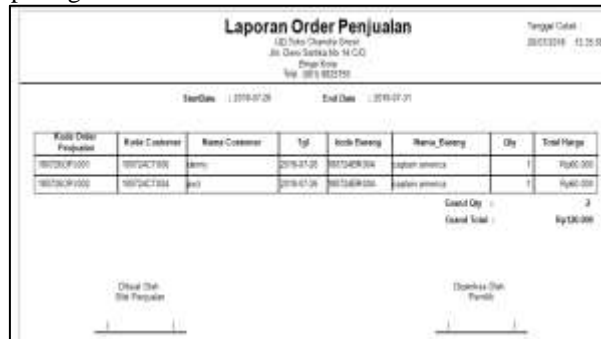
Gambar 4. Laporan Order Penjualan

Menu laporan ini terdiri dari Laporan Supplier ; Laporan Customer ; Laporan Pembelian (laporan order pembelian , laporan pembelian, laporan retur pembelian); Laporan Penjualan (laporan order penjualan , laporan penjualan, laporan retur penjualan); Laporan Barang (laporan barang dan laporan penyesuaian persediaan); Laporan Penerimaan Barang (laporan penerimaan barang pembelian, laporan penerimaan retur pembelian, laporan penerimaan retur penjualan, laporan penerimaan pengembalian barang); Laporan Pengeluaran Barang (laporan pengeluaran barang penjualan, laporan pengembalian barang retur penjualan). Berikut ini adalah tampilan laporan order penjualan ditunjukkan pada gambar berikut.