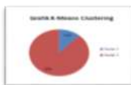
Gambar 4. Grafik K-means Clustering