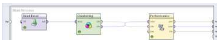
Gambar 2. Input data K-medoids Clustering pada Rapidminer