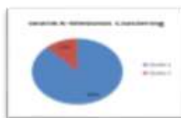
Gambar 6. Grafik K-medoids Clustering

Dapat dilihat perbedaan gambar 3 dan gambar 5, hasil Cluster Model menggunakan tools Rapidminer dengan menggunakan data kasus yang sama, tetapi dengan metode yang berbeda. Pembacaan cluster pada Rapidminer dimulai dari cluster 0 (nol), sementara pada teori clustering dimulai dari cluster 1 . Sehingga untuk cluster_0 pada Rapidminer sama dengan cluster 1 (C1) pada perhitungan secara teori. Hasil yang diperoleh menggunakan K-Means yaitu 4 provinsi untuk C1, dan 30 provinsi untuk C2. Sementara pada K-Medoids , hasil yang diperoleh C1 ada 30 provinsi dan C2 4 provinsi. Untuk lebih memperjelas item-item apa saja yang terdapat pada cluster model tersebut, dapat dilihat sebagai berikut :