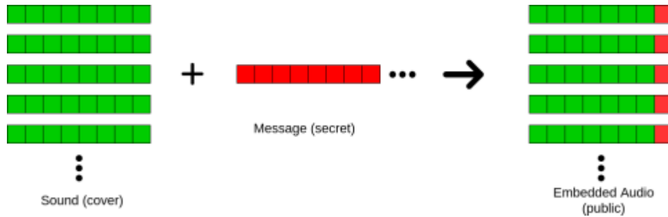
Gambar 2. Proses penyisipan pesan rahasia melalui metode LSB

Banyak metode yang dapat digunakan dalam steganografi, dan yang paling populer adalah Least Significant Bit (LSB) . Metode ini mengganti bit yang kurang berarti atau tidak terlalu mempengaruhi data. Bit yang kurang mempengaruhi ini ada di bagian paling kanan dalam sebuah kumpulan byte . Walaupun ada penelitian yang berhasil mempertahankan ukuran media stego sehingga tidak berubah dari file aslinya [5],[6]. Metode LSB yang digunakan dalam penelitian ini.