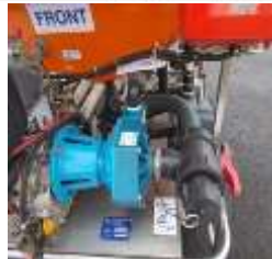
Gambar 3. Pompa Sentrifugal