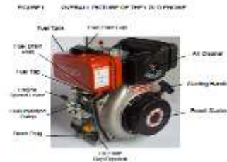
Gambar 2. Mesin Diesel 6,7 HP

Spesifikasi Mesin Diesel 6,7 HP sebagai berikut: