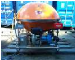
Gambar 1. Peralatan Mesin TC3 Sprayer